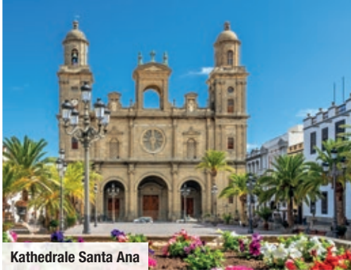
Kathedrale Santa Ana