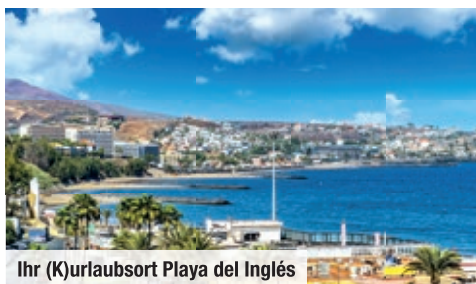
Ihr (K)urlaubsort Playa del Inglés