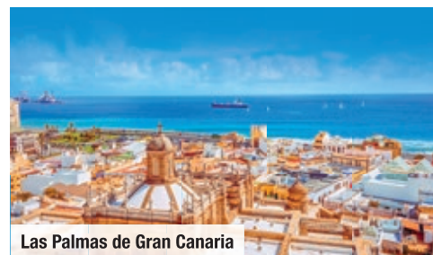
Las Palmas de Gran Canaria