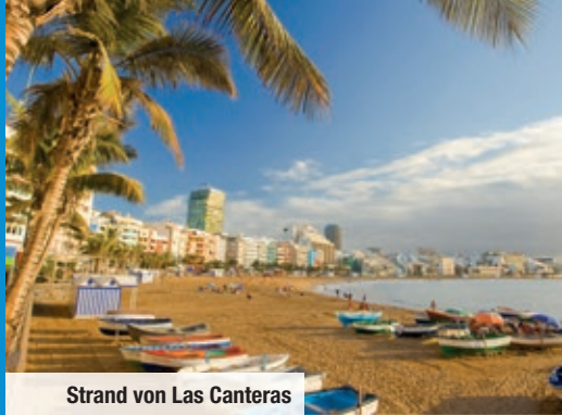
Strand von Las Canteras