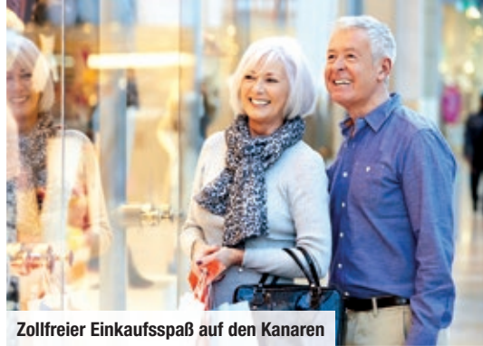
Zollfreier Einkaufsspaß auf den Kanaren