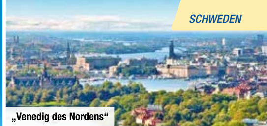
„Venedig des Nordens“