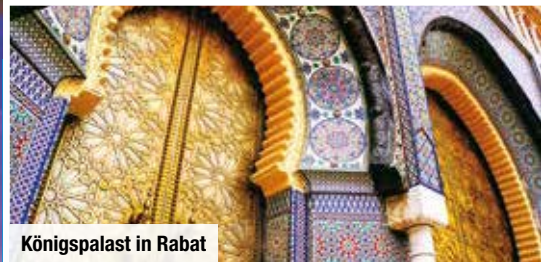
Königspalast in Rabat