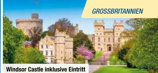
Windsor Castle inklusive Eintritt