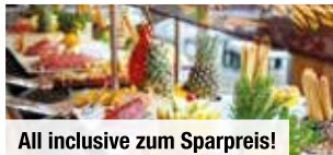
All inclusive zum Sparpreis!

Freuen Sie sich auf je 3x Klassische Massage, Infrarotlicht-Behandlung nach Petzold, Wellness-Fußreflexzonen-Behandlung inkl. Massage, Kirschkerne-Wärmebehandlung und Wellness-Massage. Die Anwendungen finden parallel in 2er-Kombinationen zu je 15 Minuten statt.