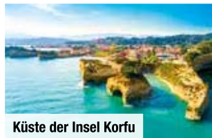
Küste der Insel Korfu