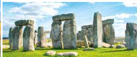
Stonehenge inklusive Eintritt