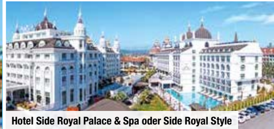
Hotel Side Royal Palace & Spa oder Side Royal Style