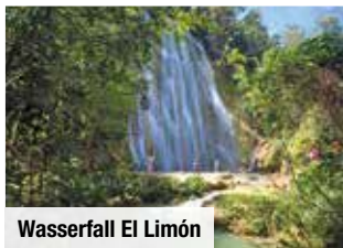
Wasserfall El Limón

Tag 4: Eine leichte Wanderung bringt Sie zum 40 m hohen Wasserfall Salto de Jimenoa . Anschließend erleben Sie in der Kaffeefabrik Monte Alto eine Führung und Verkostung. Weiterfahrt nach Santiago und Stadtrundgang.