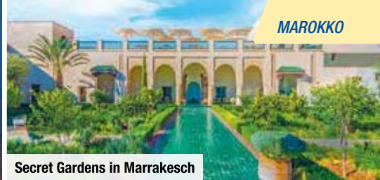
Secret Gardens in Marrakesch