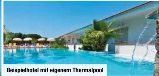
Beispielhotel mit eigenem Thermalpool