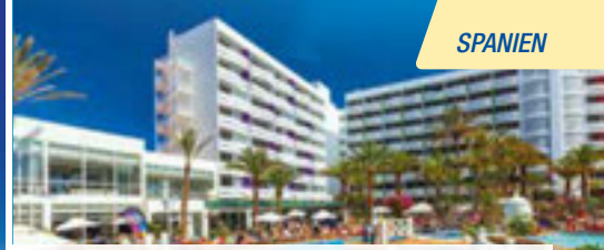
4-Sterne-Hotel Abora Buenaventura by Lopesan Hotels