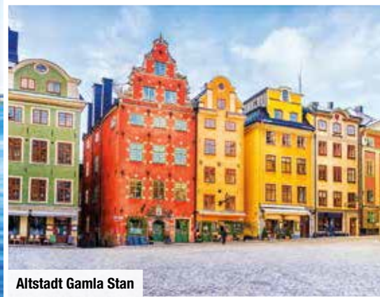
Altstadt Gamla Stan