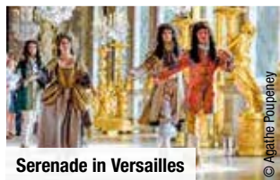
Serenade in Versailles

Paris: Hier duftet es nach köstlichen Backwaren, hier ragt der Eiffelturm in den blauen Himmel und hier herrscht der Glanz längst (noch nicht) vergangener Zeiten! Die Seine ist ein Sehnsuchtsort Romantikliebender und in Montmartre fühlen auch Sie sich wie ein junger Pablo Picasso. Höhepunkt ist Ihre Teilnahme an der Serenade in Versailles. Zwei Ganztagesausflüge und die Halbpension sind bereits inkludiert. Verlieben Sie sich in Paris!