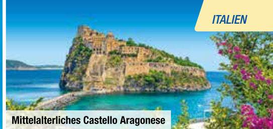
Mittelalterliches Castello Aragonese