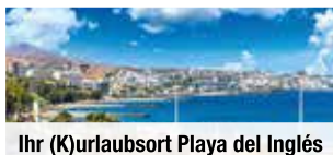
Ihr (K)urlaubsort Playa del Inglés