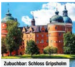
Zubuchbar: Schloss Gripsholm

Alle verfügbaren Reiseternine & Flughäfen finden Sie auf trendtours.de