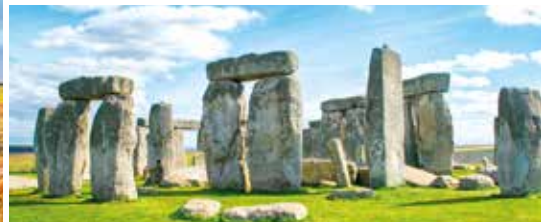
Stonehenge inklusive Eintritt