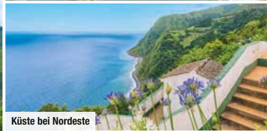
Küste bei Nordeste