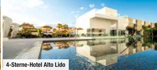
4-Sterne-Hotel Alto Lido