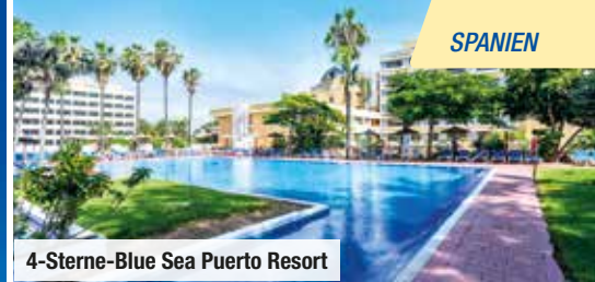
4-Sterne-Blue Sea Puerto Resort