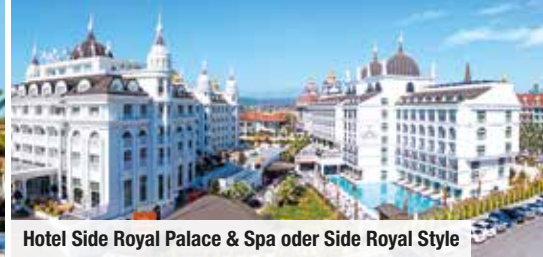
Hotel Side Royal Palace & Spa oder Side Royal Style