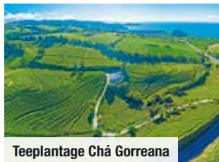
Teepflanzung Chá Gorreana

Tag 8: Rückflug voller wunder-schöner Eindrücke nach Hause.