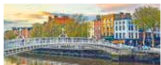
Stadtrundfahrt in Dublin inklusive

Bei Vorabbuchung sparen Sie € 20 p.P. € 139 p.P.