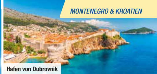
Hafen von Dubrovnik