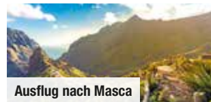
Ausflug nach Masca