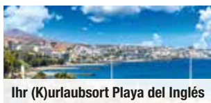
Ihr (K)urlaubsort Playa del Inglés