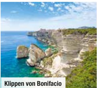
Klippen von Bonifacio

Sichern Sie sich jetzt exklusiv Ihre Außenkabine Nur Vorabbuchung € 59 p.P.