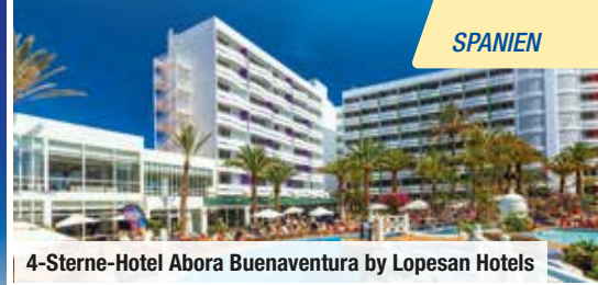
4-Sterne-Hotel Abora Buenaventura by Lopesan Hotels