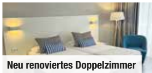
Neu renoviertes Doppelzimmer

Tag 2 bis 7: Im Urlaubsort Puerto de la Cruz sind viele Geschäfte, Bars und Restaurants in den zahlreichen alten Gassen und Straßen zu entdecken. Ein Besuch lohnt sich auch im Botanischen Garten, im wunderschönen Meeresschwimmbad Lago Martiánez und im Loro Parque. Unser Inklusiv-Ausflug führt Sie nach Santa Cruz , Hauptstadt Teneriffas. Die Inselmetropole ist das Zentrum für Shopping, Kunst und Genuss. Noch mehr Insel Schönheiten können mit unseren zahlreichen zubuchbaren Ausflügen entdeckt werden.