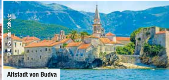
Altstadt von Budva