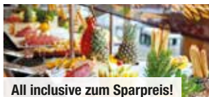
All inclusive zum Sparpreis!

Freuen Sie sich auf je 3x Klassische Massage, Infrarotlicht-Behandlung nach Petzold, Wellness-Fußreflexzonen-Behandlung inkl. Massage, Kirschkerne-Wärme-therapie, Hot-Stone-Behandlung und Wellness-Massage. Die Anwendungen finden parallel in 2er-Kombinationen zu je 15 Minuten statt.