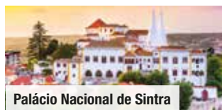
Palácio Nacional de Sintra

Tag 4: Ganztagesausflug an die Algarve mit Sagres, Lagos & Silves