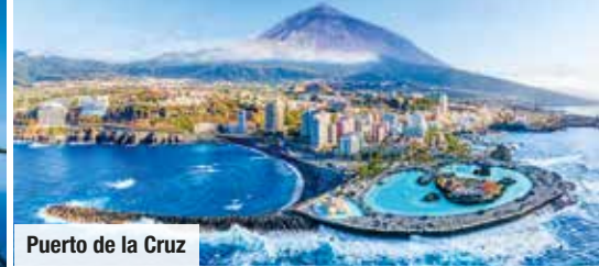
Puerto de la Cruz