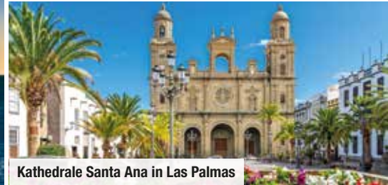
Kathedrale Santa Ana in Las Palmas