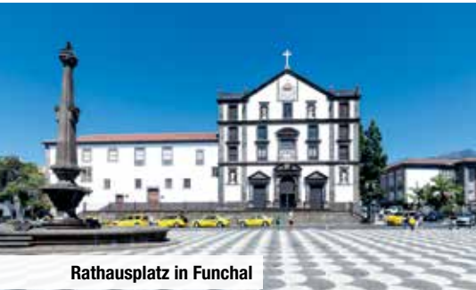
Rathausplatz in Funchal