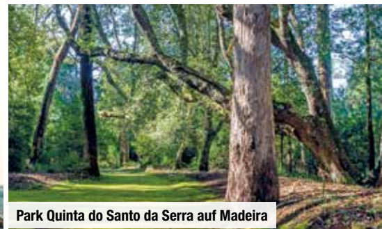
Park Quinta do Santo da Serra auf Madeira