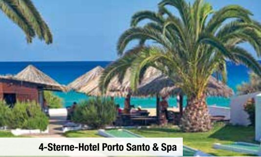
4-Sterne-Hotel Porto Santo & Spa