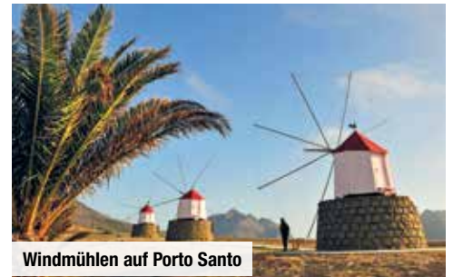
Windmühlen auf Porto Santo