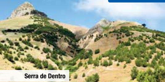
Serra de Dentro