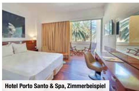
Hotel Porto Santo & Spa, Zimmerbeispiel