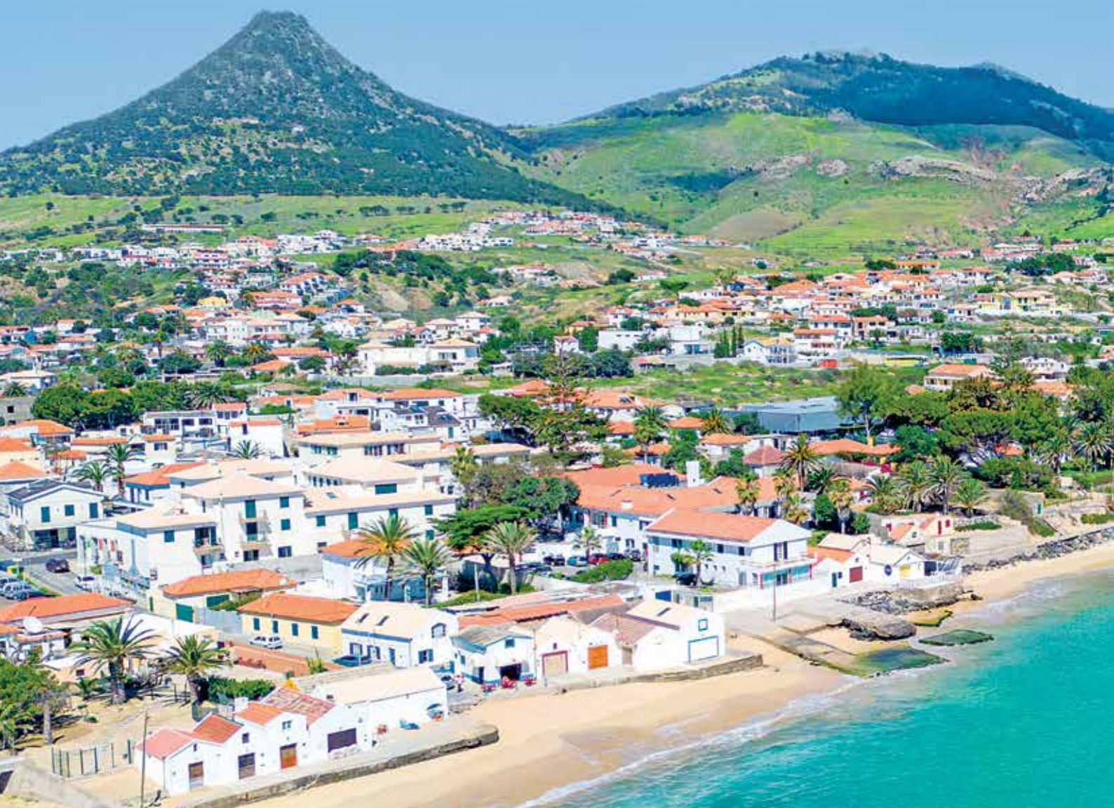
Strand von Porto Santo