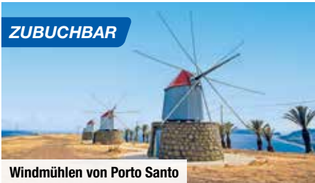
Windmühlen von Porto Santo