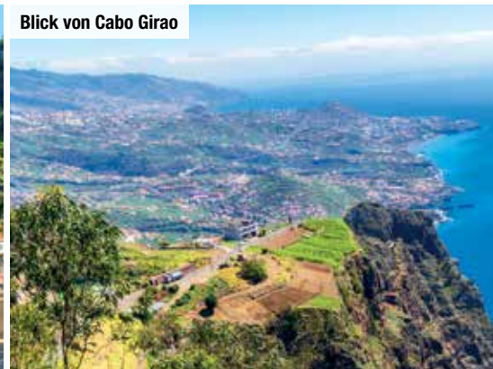
Blick von Cabo Girao