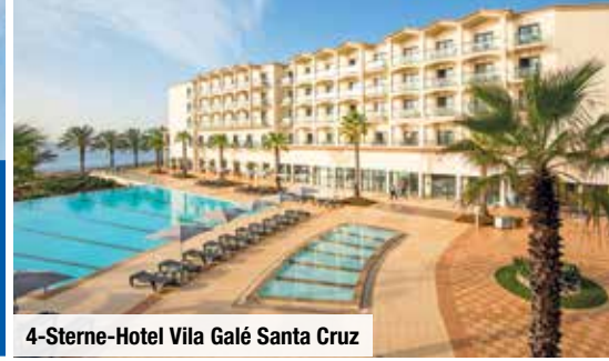
4-Sterne-Hotel Vila Galé Santa Cruz

Die goldgelben Sandstrände des „heiligen Hafens“ sind bekannt für ihre heilende Wirkung. So machen Baden und Strandspaziergänge gleich doppelt so viel Spaß. Gönnen Sie sich Ihre Auszeit auf Porto Santo und kehren Sie erholt und voller Lebenskraft in die Heimat zurück.