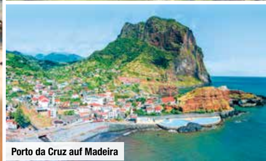
Porto da Cruz auf Madeira