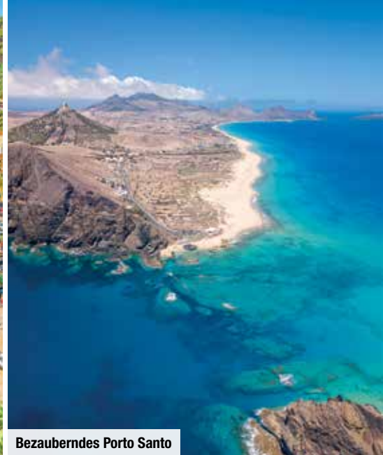
Bezauberndes Porto Santo

Madeira beeindruckt mit phänomenalen Landschaftsformen wie urigen Bergen, wildromantischen Tälern und schroffen Steilklippen, die aufgrund des günstigen Klimas und der fruchtbaren Vulkanerde von einer einzigartigen Flora bewachsen werden.