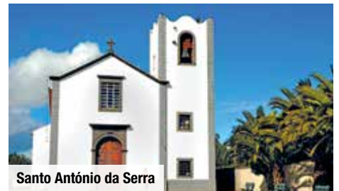
Santo António da Serra

Danach gönnen Sie sich eine Kostprobe des „Vinho do Porto Santo“, des köstlichen Inselweins, dem das atlantische Klima die gewisse Extraportion Würze verleiht.