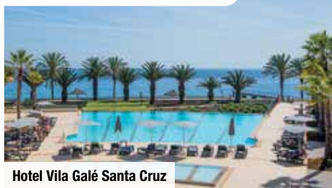
Hotel Vila Galé Santa Cruz