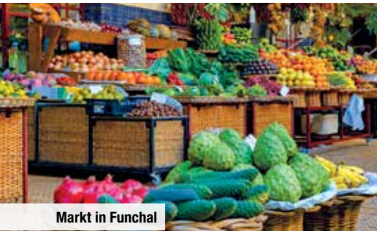
Markt in Funchal