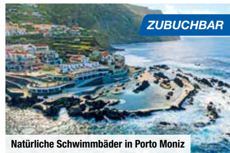
Natürliche Schwimmbäder in Porto Moniz

Beim Besuch des Botanischen Gartens von Funchal staunen Sie über die üppige Blühpacht der fruchtbaren und klimatisch begünstigten Insel. Sie sehen subtropische Nutzpflanzen, die einheimische Flora und den Ornamentgarten, dessen Wege und Plätze als Mosaik aus Rundkieseln ganz in der portugiesischen Tradition angelegt sind.