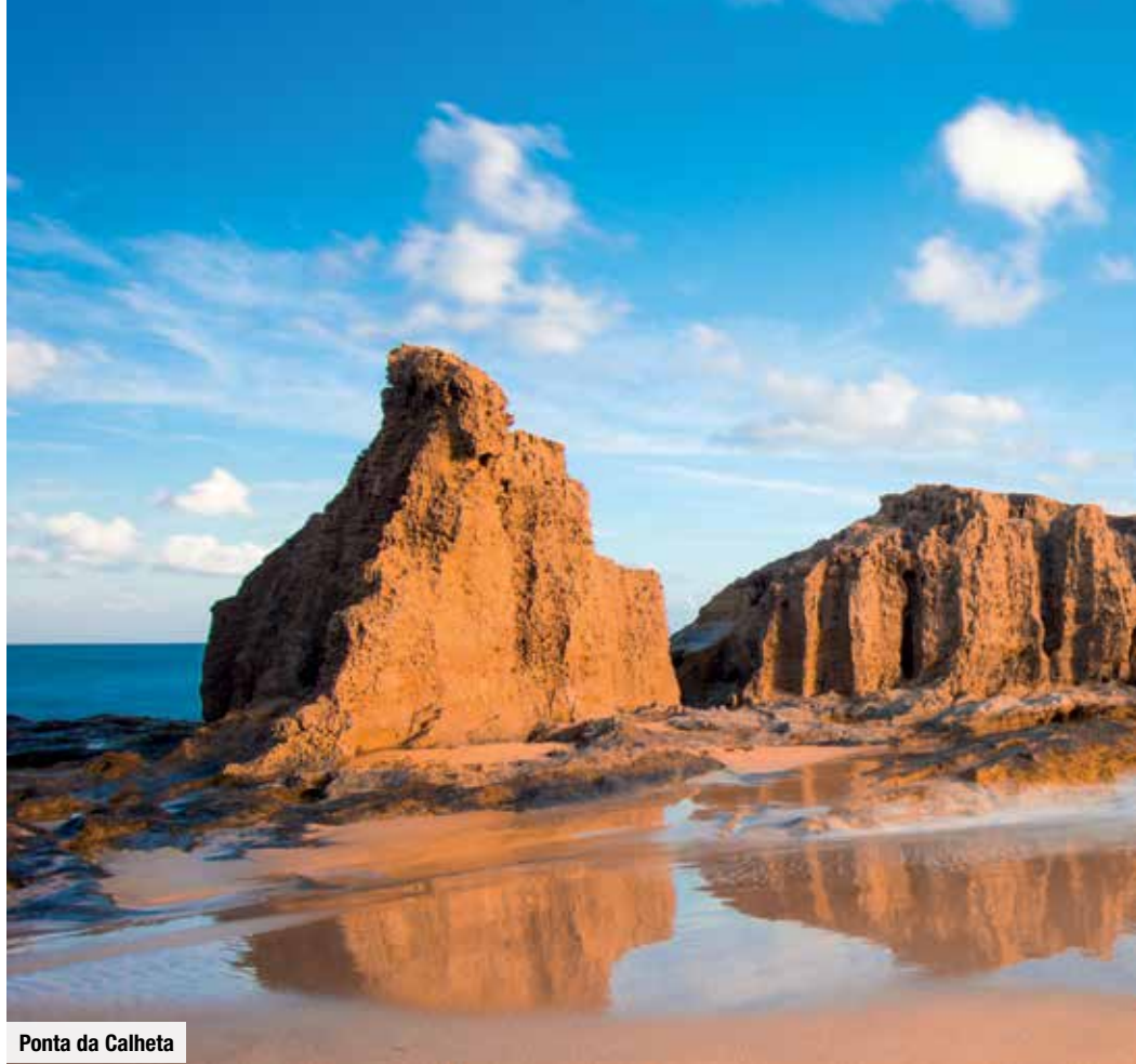
Ponta da Calheta

das vorgelagerte unbewohnte Eiland Ilhéu da Cal. Bei guter Sicht können Sie sogar Madeira sehen. Ihr nächster Stopp an den Basaltsäulen von Lapeira zeigt Ihnen eindrucksvoll die „bewegte Vergangenheit“ Porto Santos. Wie Madeira wurde die Insel aus dem Feuer der Vulkane erschaffen, flüssige Lava erstarrte hier sehr langsam und schuf die bizarren Formationen.