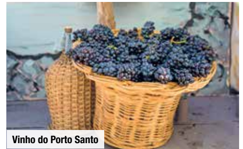
Vinho do Porto Santo