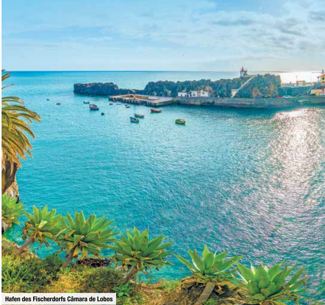
Hafen des Fischerdorfs Câmara de Lobos