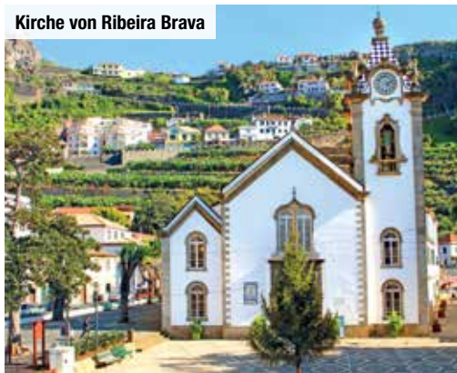
Kirche von Ribeira Brava