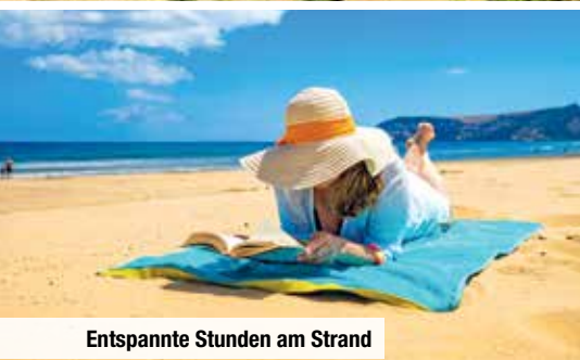
Entspannte Stunden am Strand