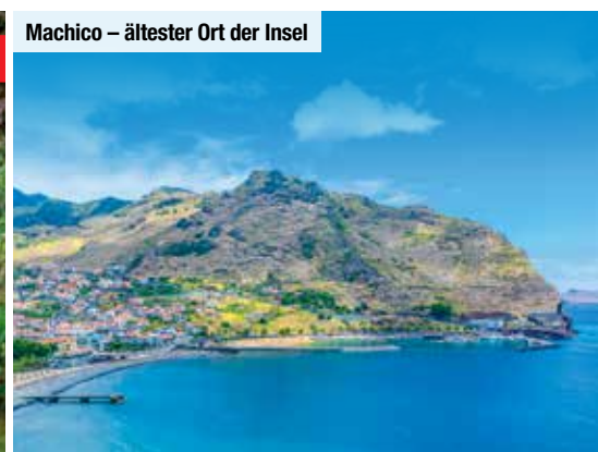
Machico – ältester Ort der Insel