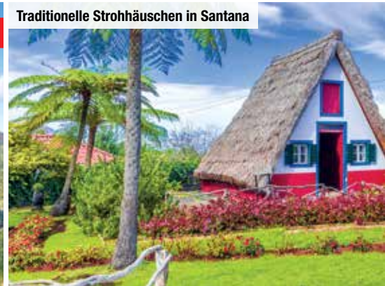
Traditionelle Strohhäuschen in Santana