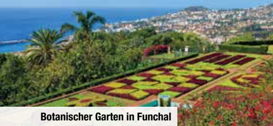
Botanischer Garten in Funchal