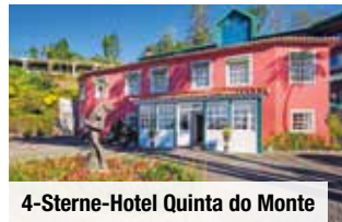
4-Sterne-Hotel Quinta do Monte

Tag 7: Fahrt zum Fischerdorf Câmara de Lobos . Wanderung entlang der Südküste und durch Funchal mit Avenida Arriaga und Besuch der Kathedrale von Funchal,