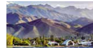
Jurtencamp am Yssykköl-See

Die entlegenen Regionen im tiefsten Zentralasien sind Ort des Austauschs zwischen Orient und Okzident. Die Seidenstraße verband Europa und Asien mit Waren, Ideen und Glauben. Entdecken Sie Bischkek und Almaty, erleben Sie Schymkent, Taschkent und Samarkand und genießen Sie Ihr Erlebnis-Genusspaket. Urwüchsige Natur und einen kristallinen Gebirgssee finden Sie in Kirgisistans Gebirgswelt, in der Sie sogar eine Nacht in einem traditionellen Jurtencamp verbringen.