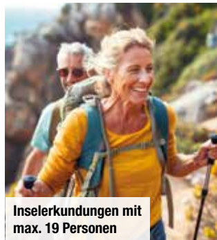
Inselerkundungen mit max. 19 Personen