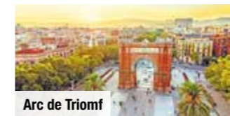
Arc de Triomf