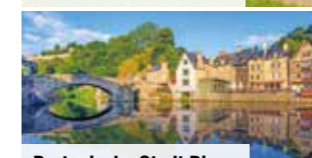
Bretonische Stadt Dinan

Anschließend geht es nach Arromanches-les-Bains, wo Sie die geschichtsträchtigen Alliiertenstrände besuchen. Erste von zwei Übernachtungen bei Saint-Brieuc.