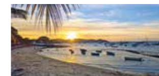
Praia dos Ossos - Strand in Búzios

Badeverlängerung auf der Halbinsel von Búzios mit 5 Übernachtungen inkl. Frühstück im Boutique-Hotel La Chimère Pousada (portugiesisch/englischsprachig) Nur Vorabbuchung € 449 p.P. Abendessen und Tango-Show „El Viejo Almacén“ (ca. 4,5h)