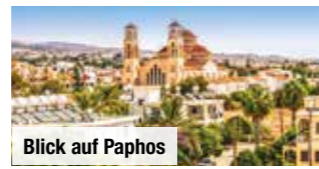
Blick auf Paphos

Doppelzimmer Deluxe mit Meerblick, nur Vorabbuchung November € 99 p.P. September & Oktober € 129 p.P.