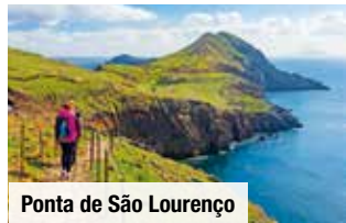
Ponta de São Lourenço

Tag 3: Fahrt im Kleinbus nach Fanal . Wanderung durch den Lorbeerwald, der zum UNESCO-Weltnaturerbe gehört. Anschließend Panoramafahrt entlang der Nordküste zurück zum Hotel (ca. 5,5 km/ ca. 2 Std. & 180 Höhenmeter).