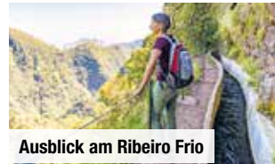
Ausblick am Ribeiro Frio