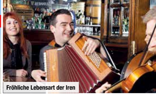
Fröhliche Lebensart der Iren