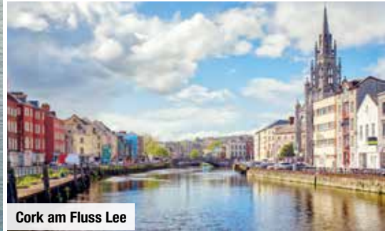
Cork am Fluss Lee

Freilichtmuseum Folk Park bestaunen Sie traditionelle Bauern- und Stadthäuser, zudem werden hier alte Handwerksberufe vorgeführt. Schiefer- und strohbedeckte Häuschen, Blumengärten, Kirchen und betagte Bäume machen Adare zu einer altirischen Parade-Ortschaft. Auch die Halbinsel Dingle ist eine Augenweide! Einem Finger ähnelnd ragt sie in den rauen Atlantik und ist mit kulturellen Relikten und spektakulären Aussichten auf einsame Strände, steile Küsten und grüne Hügel übersät.