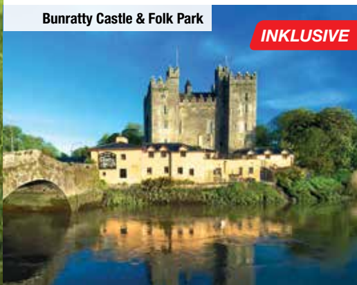
Bunratty Castle & Folk Park

Ihre Rundreise führt Sie heute zunächst zum Bunratty Castle, einer vollständig restaurierten und eingerichteten Burg. Im