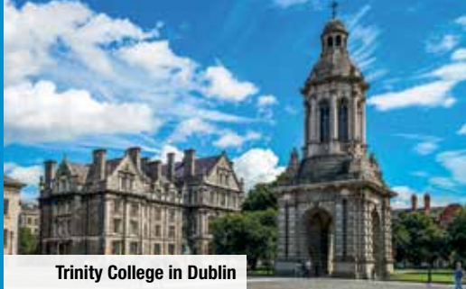
Trinity College in Dublin