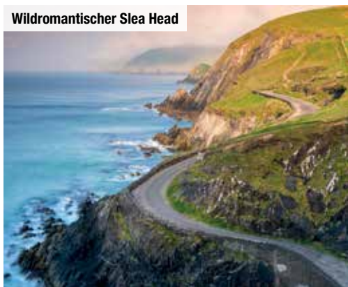
Wildromantischer Sleat Head