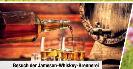
Besuch der Jameson-Whiskey-Brennerei