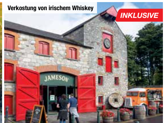
Verkostung von irischem Whiskey