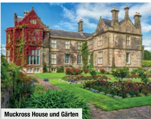
Muckross House und Gärten

nur mit zeitlich befristetem Aktions-Code