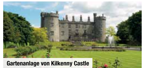
Gartenanlage von Kilkenny Castle