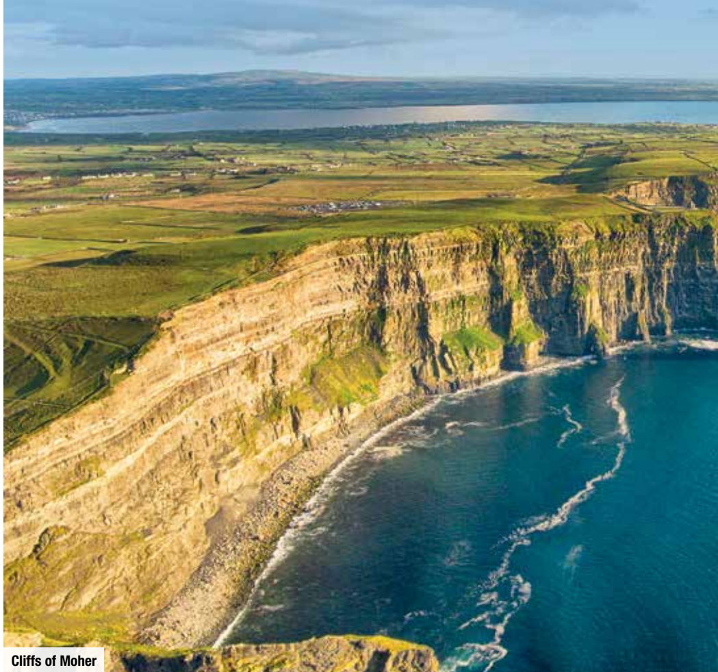
Cliffs of Moher