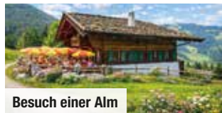
Besuch einer Alm