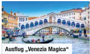
Ausflug „Venezia Magica“

Halbpension 5 x Abendessen als 3-Gänge-Menü oder in Büfettform Nur Vorabbuchung € 79 p. P. Ganztagesausflug „Prachtvolles Triest“ Bei Vorabbuchung € 69 p. P. sparen Sie € 10 p. P. € 59 p. P.