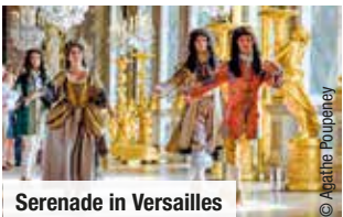
Serenade in Versailles

Paris: Hier duftet es nach köstlichen Backwaren, hier ragt der Eiffelturm in den blauen Himmel und hier herrscht der Glanz längst (noch nicht) vergangener Zeiten! Die Seine ist ein Sehnsuchtsort Romantikliebender und in Montmartre fühlen auch Sie sich wie ein junger Pablo Picasso. Höhepunkt ist Ihre Teilnahme an der Serenade in Versailles. Zwei Ganztagesausflüge und die Halbpension sind bereits inkludiert. Verlieben Sie sich in Paris!