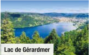
Lac de Gérardmer

1 x Abendessen als 3-Gänge-Menü im Hotel, 1 x Melker-Essen auf einem bewirtschafteten Bauernhof oder im Höhenrestaurant u. 1 x 3-Gänge-Menü im Restaurant des Freilichtmuseums Nur Vorabbuchung € 95 p. P.