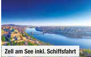
Zell am See inkl. Schiffsfahrt

Bei Vorabbuchung sparen Sie € 10 p.P. € 59 p.P.