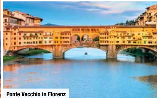
Ponte Vecchio in Florenz