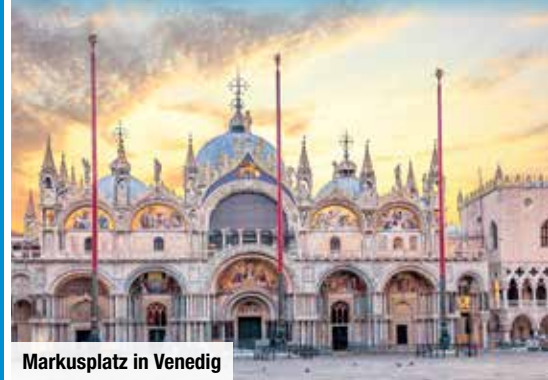
Markusplatz in Venedig

Änderung der Programmreihenfolge vorbehalten