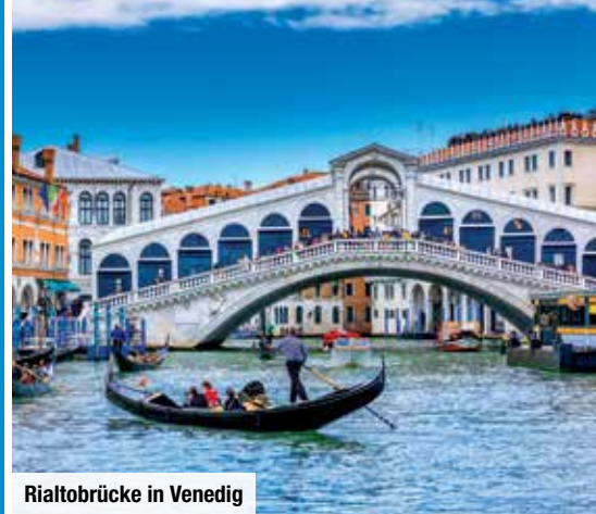
Rialto-Brücke in Venedig