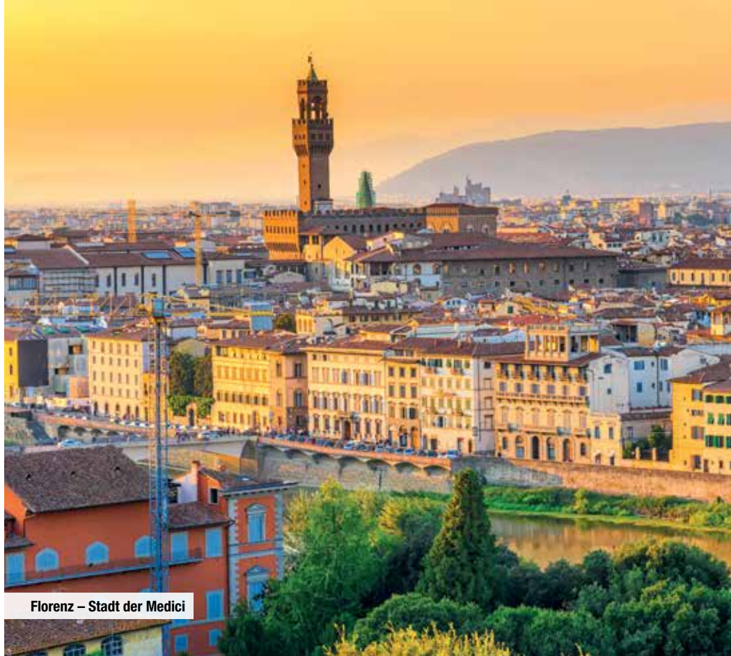
Florenz – Stadt der Medici