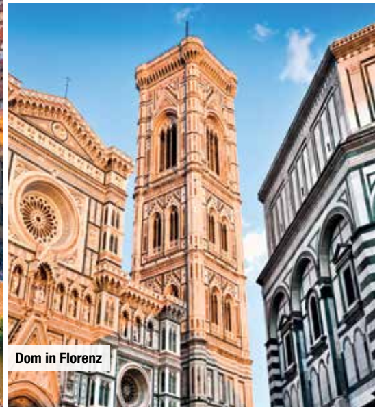
Dom in Florenz