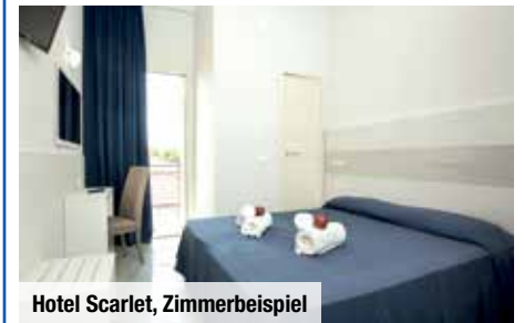
Hotel Scarlet, Zimmerbeispiel