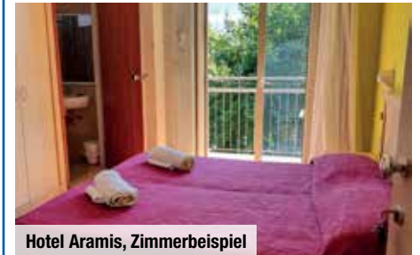
Hotel Aramis, Zimmerbeispiel

Ihr 3-Sterne-Hotel liegt maximal 400 Meter vom feinen Sandstrand der Adria entfernt. Sie nächtigen in einem Doppelzimmer und genießen Ihre Halbpension ganz entspannt direkt im Hotel.