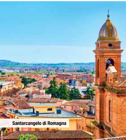
Santarcangelo di Romagna