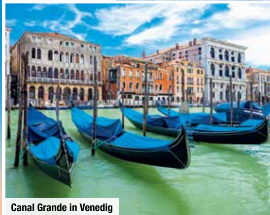
Canal Grande in Venedig