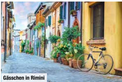
Gässchen in Rimini