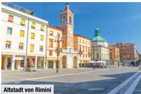
Altstadt von Rimini