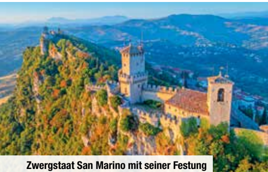
Zwergstaat San Marino mit seiner Festung