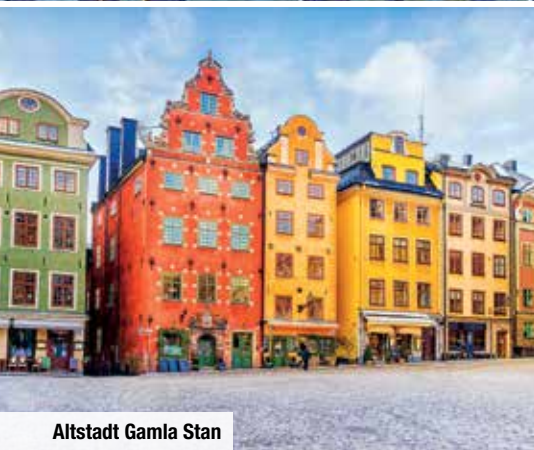
Altstadt Gamla Stan