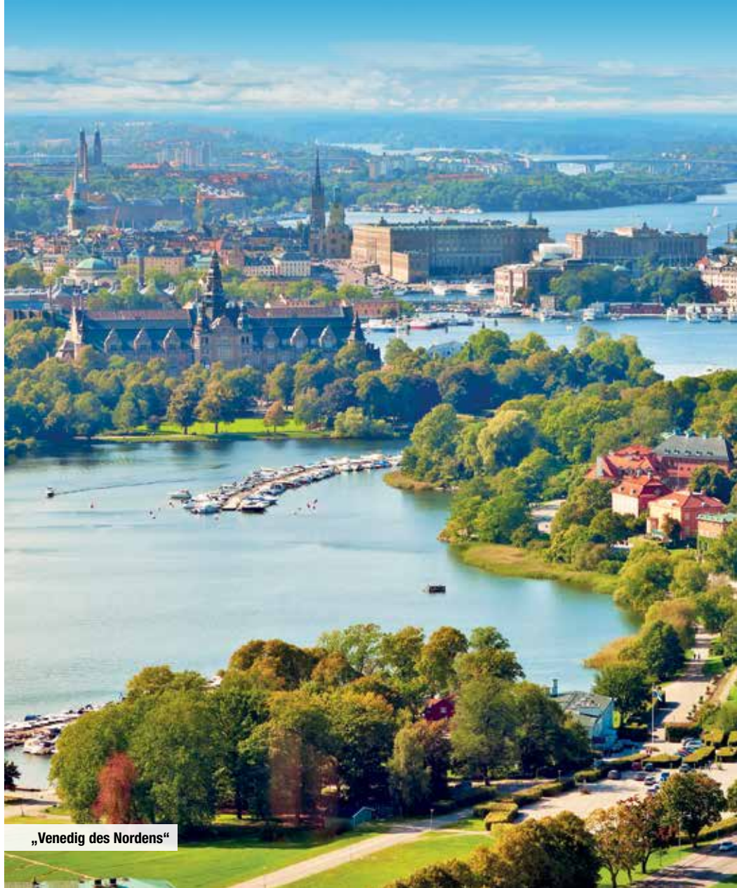
„Venedig des Nordens“

Tag 3: Heute haben Sie die Wahl zwischen einem Tag zur freien Verfügung in Stockholm oder einem faszinierenden Tagesausflug in die Region um den Mälarsee. In Mariefred bestaunen Sie von außen das Schloss Gripsholm – eines der bekanntesten Renaissanceschlösser Schwedens,