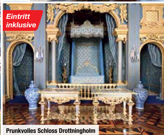
Prunkvolles Schloss Drottningholm