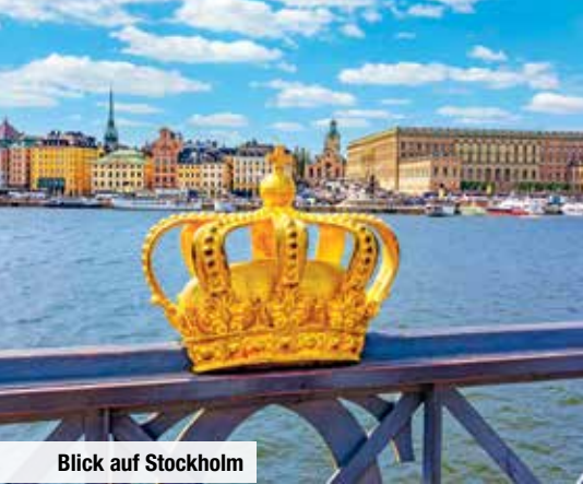
Blick auf Stockholm