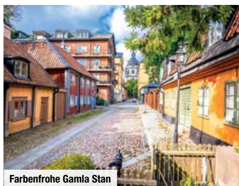
Farbenfrohe Gamla Stan

nur mit zeitlich befristetem Aktions-Code