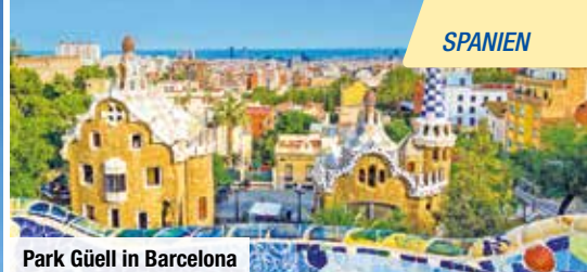
Park Güell in Barcelona

Bei Vorabbuchung sparen Sie € 10 p. P. € 79 p. P.