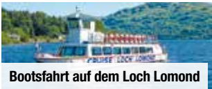
Bootsfahrt auf dem Loch Lomond