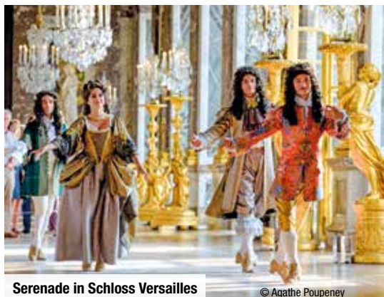
Serenade in Schloss Versailles