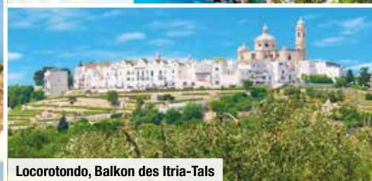
Locorotondo, Balkon des Itria-Tals