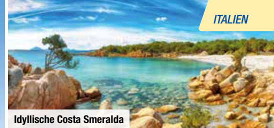
Idyllische Costa Smeralda