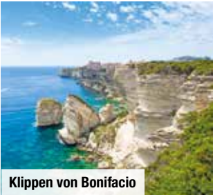
Klippen von Bonifacio

Sichern Sie sich jetzt exklusiv Ihre Außenkabine Nur Vorabbuchung € 59 p. P.