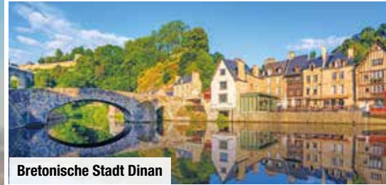
Bretonische Stadt Dinan