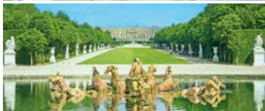
Apollo-Brunnen in den Gärten von Versailles