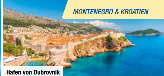
Hafen von Dubrovnik