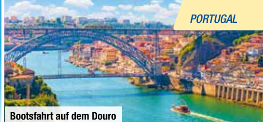
Bootsfahrt auf dem Douro