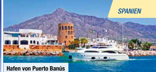
Hafen von Puerto Banús