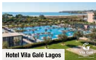
Hotel Vila Galé Lagos

Doppelzimmer mit Meerblick im Hotel Vila Galé Lagos ab Tag 7 (nur bei Buchung der Verlängerungswoche möglich) Nur Vorabbuchung ab € 179 p. P.