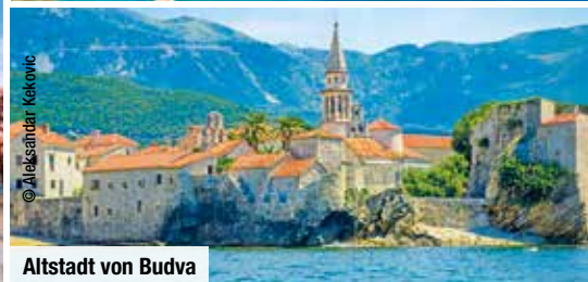
Altstadt von Budva