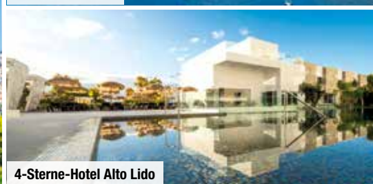
4-Sterne-Hotel Alto Lido