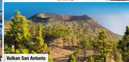
Vulkan San Antonio