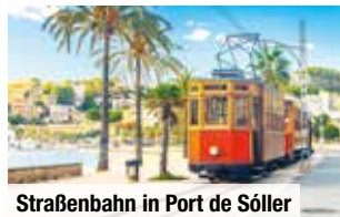
Straßenbahn in Port de Sóller