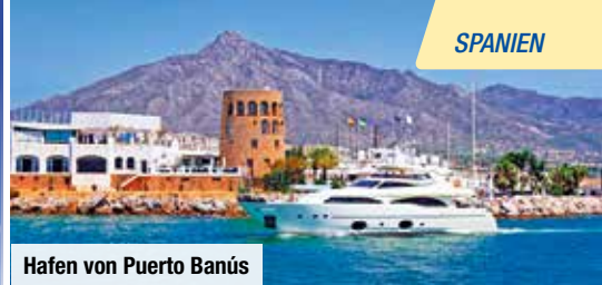
Hafen von Puerto Banús