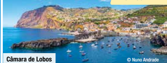
Câmara de Lobos