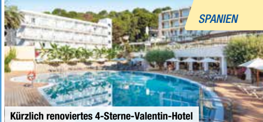
Kürzlich renoviertes 4-Sterne-Valentin-Hotel