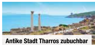
Antike Stadt Tharros zubuchbar

Ausflug „UNESCO-Weltkulturerbe Su Nuraxi & antike Stadt Tharros“ inklusive Eintritt in Su Nuraxi & Bimmelbahnfahrt € 79 p. P. Bei Vorabbuchung sparen Sie € 10 p. P. € 69 p. P.