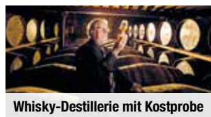
Whisky-Destillerie mit Kostprobe