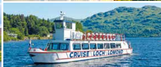
Bootsfahrt auf dem Loch Lomond inklusive