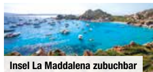
Insel La Maddalena zubuchbar

Tag 8: Mit tollen Erinnerungen im Gepäck erwartet Sie heute der Transfer zum Flughafen sowie der Rückflug.