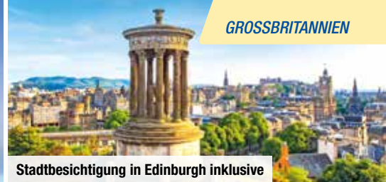
Stadtbesichtigung in Edinburgh inklusive