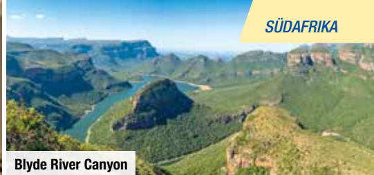
Blyde River Canyon