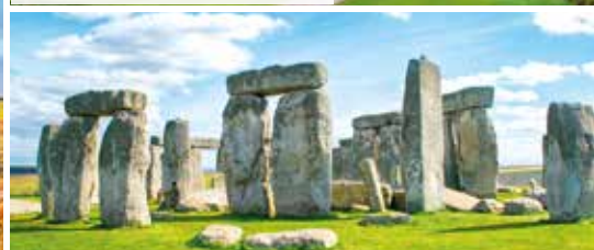
Stonehenge inklusive Eintritt