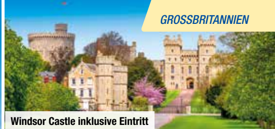
Windsor Castle inklusive Eintritt