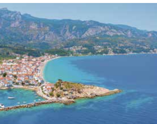
Natürliche Schönheit – Patmos

Ihre Kreuzfahrt führt Sie heute zur idyllischen Insel Patmos, wo Sie am frühen Morgen anlegen. Nutzen Sie den Tag, um die historischen Stätten zu besuchen oder die natürliche Schönheit der Insel zu genießen. Ein leckeres Abendessen und die Übernachtung finden erneut an Bord statt.