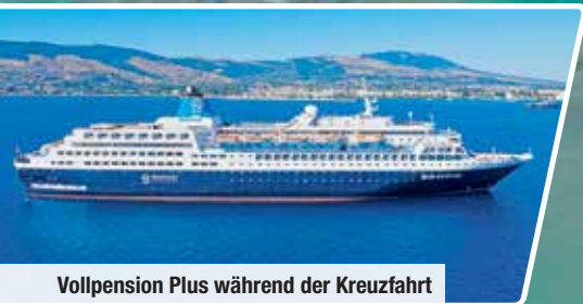
Vollpension Plus während der Kreuzfahrt

Kreuzfahrt mit den Inseln Rhodos, Kos, Samos & Patmos