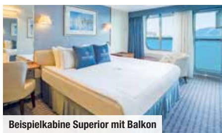
Beispielkabine Superior mit Balkon