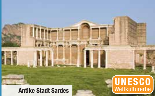
Antike Stadt Sardes