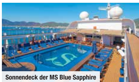
Sonnendeck der MS Blue Sapphire

Die Blue Sapphire bietet Ihnen sehr geräumige Kabinen mit höchstem Komfort. Die Vollpension inkludiert neben den 3 Hauptmahlzeiten alkoholfreie & ausgewählte alkoholische Getränke zu den Mahlzeiten sowie Teezeit & Nachtsuppe.