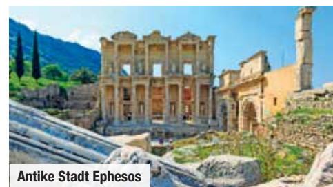
Antike Stadt Ephesos

Große Kabine (ca. 21 m²) mit Doppelbett und Balkon für fantastische Ausblicke € 349 p.P.